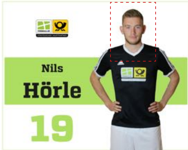
Ausgangsbild vor Zuschneidevorgang

Mit der in DFBnet integrierten Zuschneidefunktion kann das Originalbild ins optimale Format gebracht werden.